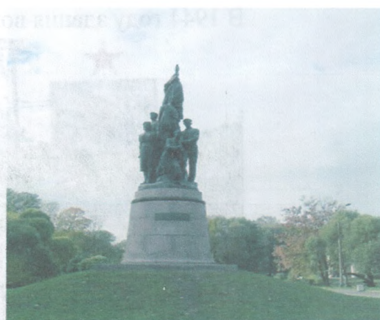
Стела Героям-пионерам в Каменске-Шахтинском