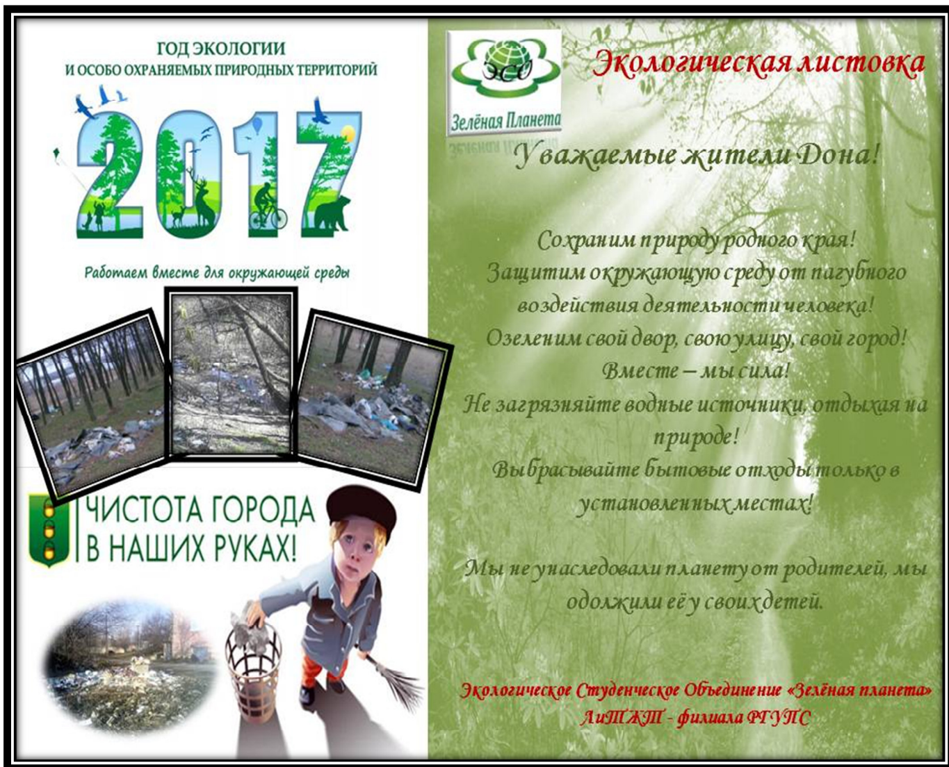
Акция «Экологическая листовка»